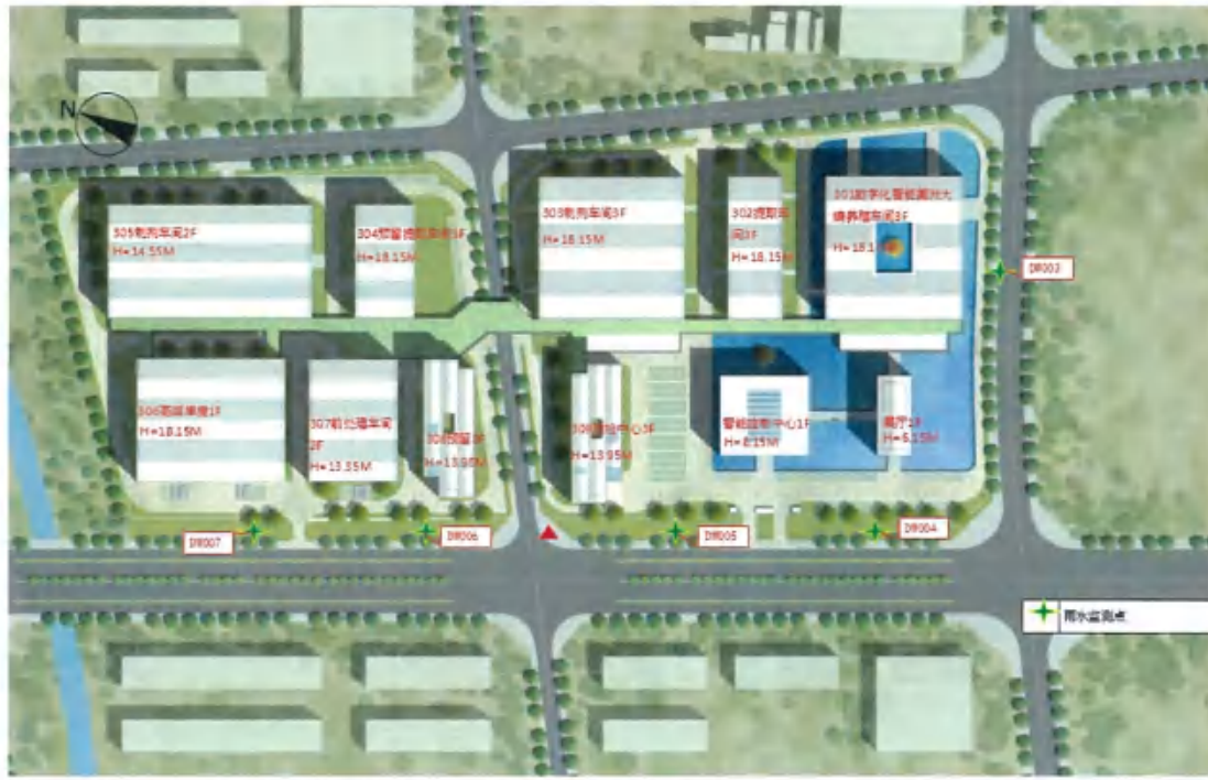
四川好医生攀西药业有限责任公司数字化智能工厂监测点位图