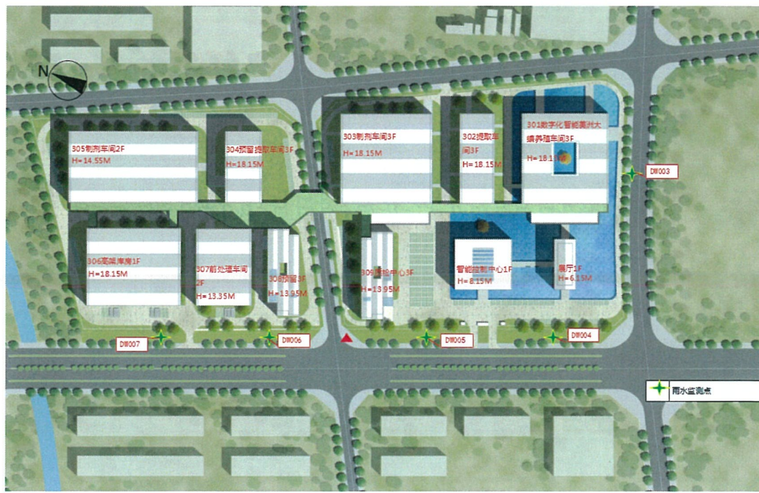
四川好医生攀西药业有限责任公司数字化智能工厂监测点位图