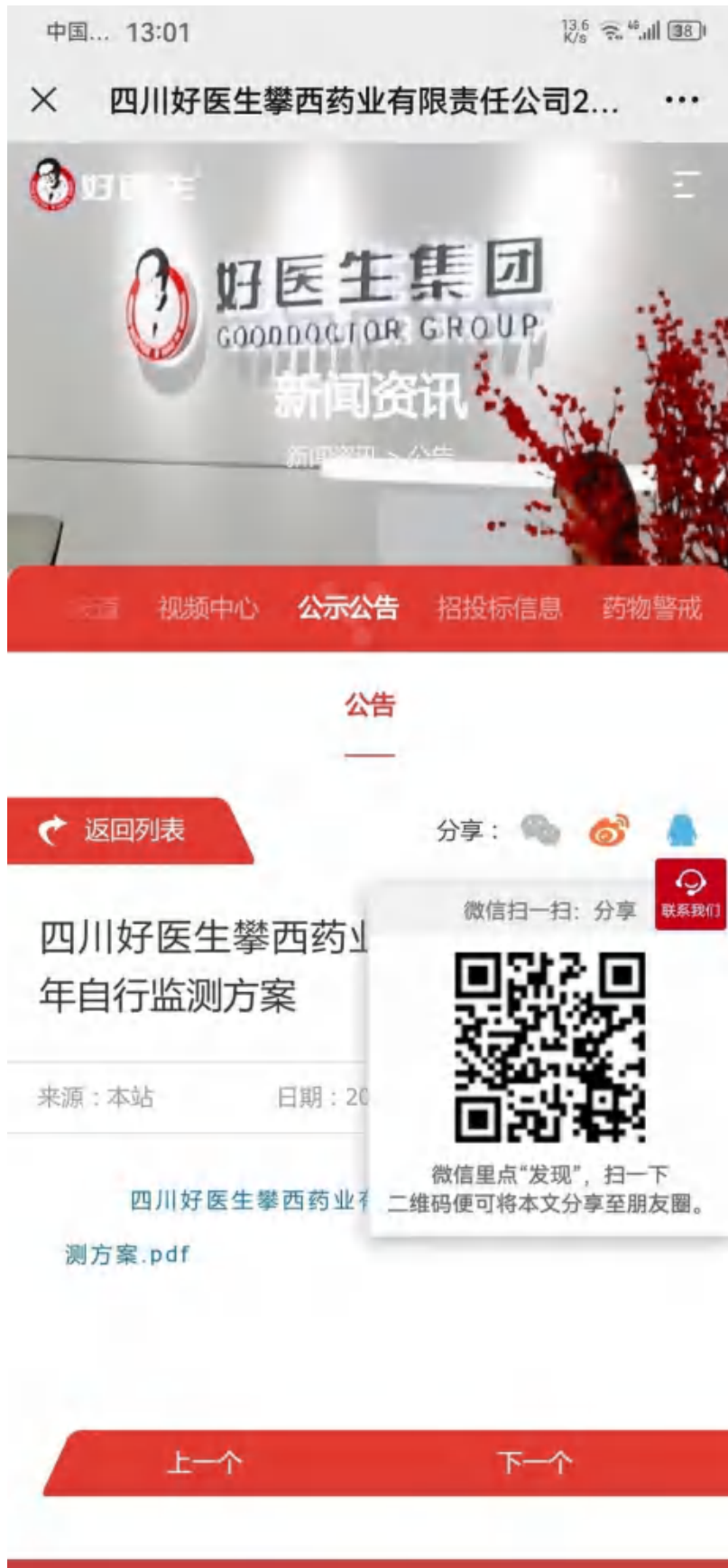
1、2024 年企业自行监测方案公开