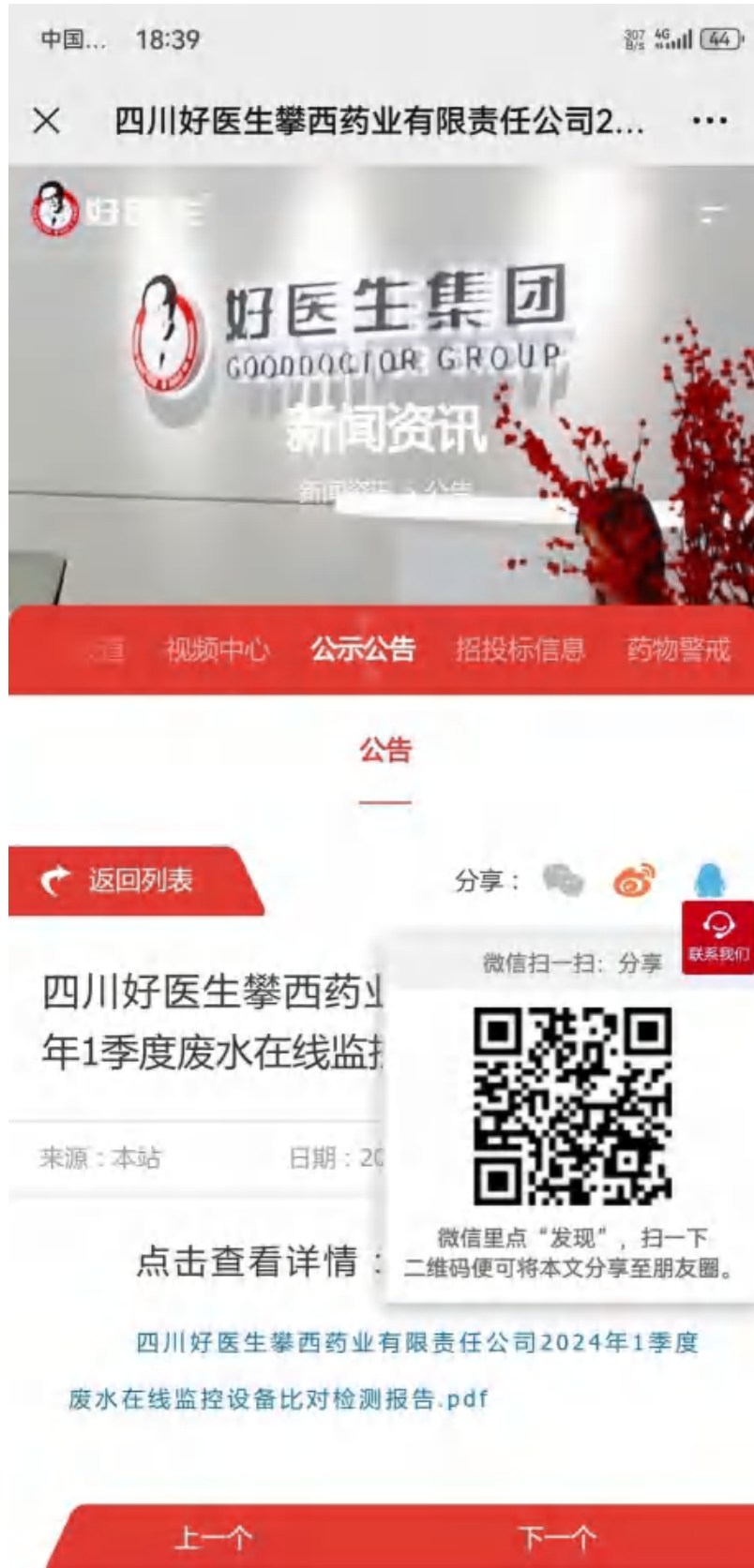
4、2024 年 1 季度废水在线监控设备比对检测报告公开